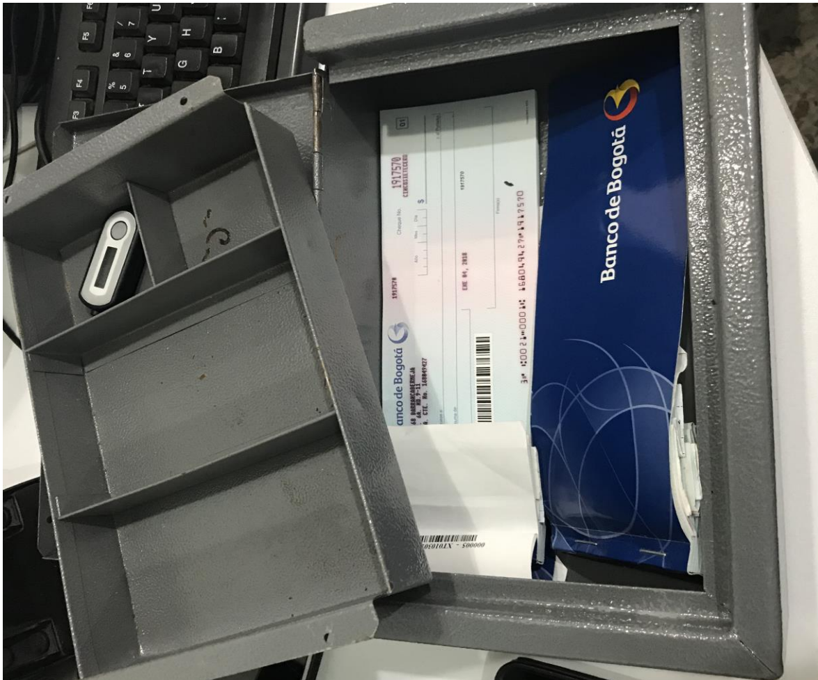
Imagen de Caja de seguridad de Pagaduría del concejo Municipal.